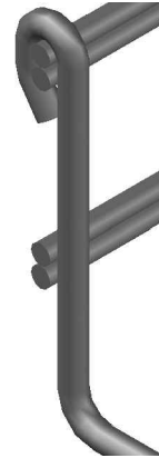
Peralte 66 mm