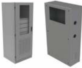
Gabinets para el Área Eléctrica