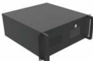
Gabinete tipo Chasis para Tarjetas Electrónicas