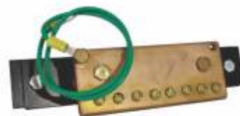
KIT DE TIERRA FÍSICA PARA GABINETE O MURO