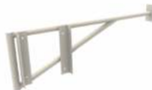
Postes y Soportes para Cámaras