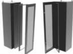
Gabinets para Automatización y Control