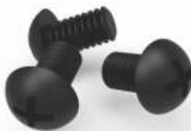
JUEGO DE TORNILLERÍA 12/24, NATURAL Y NEGRO