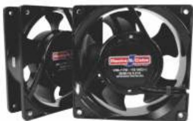
KIT DE EXTRACTORES PARA GABINETE