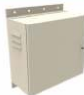
Gabinets Tipo Nema 4X con Aislante Térmico