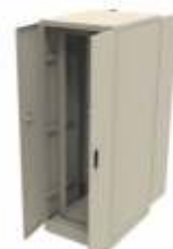
Gabinete para Control Nema 12