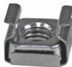
KIT DE TORNILLO Y TUERCA ENCAPSULADA