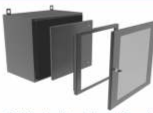
Gabinete Montaje en Pared con Marco Abatible