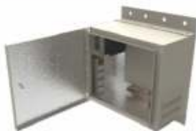
Gabinets para Exterior Tipo Nema 4X