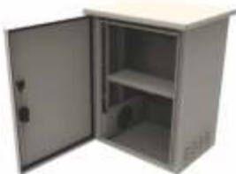
Gabinets Tipo Nema 3R