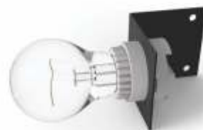
KIT DE ILUMINACIÓN