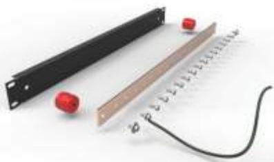
KIT DE TIERRA FÍSICA PARA MONTAJE EN RACK