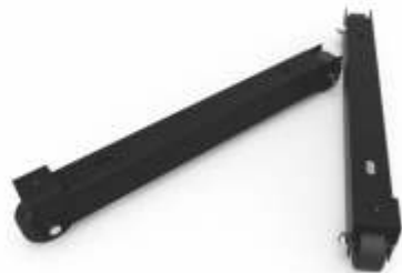
KIT DE RODILLO PARA RACK ABIERTO