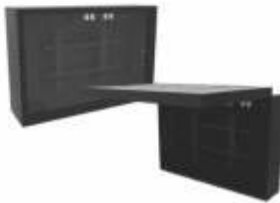
Gabinets para Resguardo de TV LED