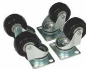
KIT DE RODAJAS PARA GABINETE