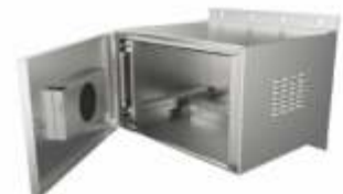
Gabinets Tipo Nema 4X, en Acero Inoxidable