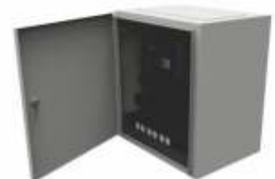
Fabricación de Gabinets Especiales de acuerdo a sus Necesidades.