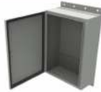
Gabinets para Montaje en Poste y/o Pared