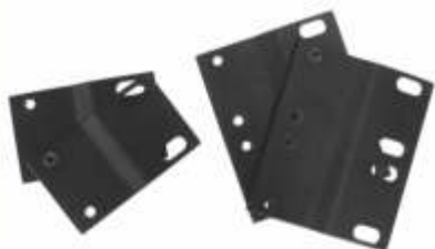
JUEGO DE EXTENSORES DE 19" A 23", 1UR O 2UR