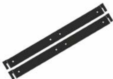
KIT DE BRACKET MONTAJE CONMUTADOR