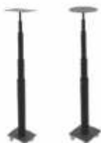
Postes para Cámaras de Monitoreo Retráctil