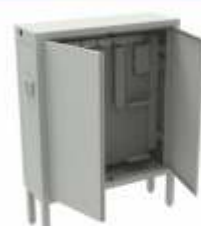
Gabinete Eléctrico o para Seguridad