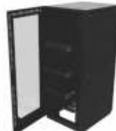
Gabinets para Servidores y Data Centers