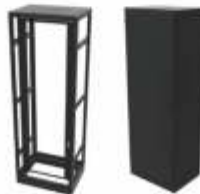
Gabinets Desarmables con Rack Abatible