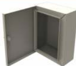
Gabinets Tipo Nema 12