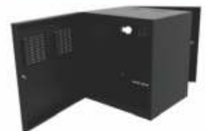
Gabinete para Equipo Activo y Cámaras de CCTV