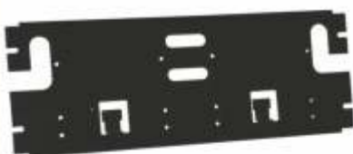
MOUNTING BRACKET PARA 200 PARES