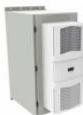
Gabinete para Exterior con Clima