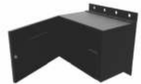
Gabinets Tipo Nema 4, para Montaje en Poste y/o Pared