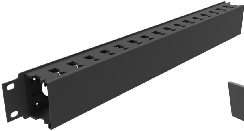
1.1 Vista Isometrica